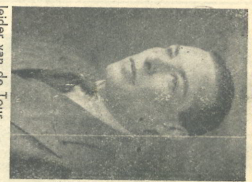
De leider van de Tour.

De wedstrijdleiding was Woensdagavond van mening, dat de spanning nu wel ondraagelijk geworden was.